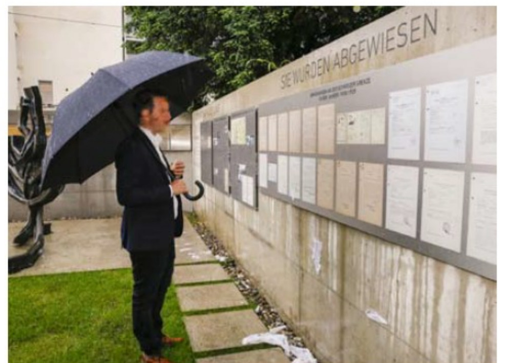
Die neue Gedenktafel bildet eine Einheit mit den schon anwesenden Portraits auf der linken Mauer und mit den Ausstellungstafeln in den Räumlichkeiten der Gedenkstätte.